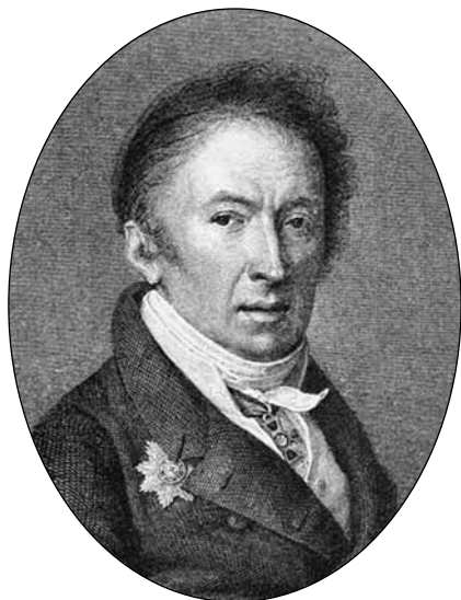
Историограф Н.М. Карамзин. Гравюра с картины Н.И. Уткина. 1818—1819 гг.

лай Михайлович Карамзин, по его сочинениям, письмам и отзывам современников. Материалы для биографии, с примечаниями и объяснения-