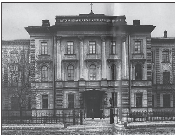
Детская больница Петра Ольденбургского. Санкт-Петербург, Лиговский пр., д. 8.

Обуховской, Петропавловской. О размахе деятельности принца Ольденбургского в Ведомстве учреждений императрицы Марии говорят следующие цифры: в 1860 году в него входило 104 учреждения, а в 1881 году — 496 в обеих столицах и в 86 городах России.