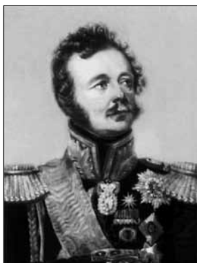
И. Ф. Паскевич-Эриванский

Медаль «Взятие Варны» — вторая в этой серии (илл. 2). Аверс ее тот же, что и на предыдущей медали (илл. 1), на реверсе — надпись в шесть строк в обрамлении из лаврового венка: «Варна храбрым русским воинством взята 11 октября 1828». Дата указана по новому стилю, надпись выполнена на латинском языке.